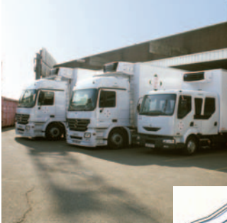
ACCÈS À L'ENTREPÔT LP ART À PARIS